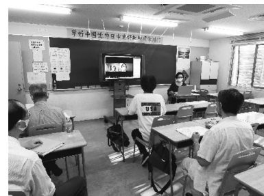
2020. 7 別科教室・オンライン 複合授業の試み