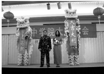
2012. 2 創立60周年記念本科大同窓会 獅子舞がオープニングを盛り上げました