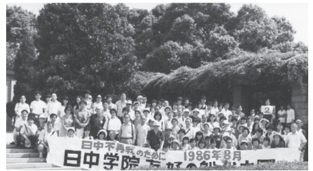
1986. 8 創立35周年記念 日中不再戦のための友好の船代表团