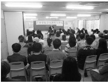
2017. 10 日本語科10月期生 第1期生入学