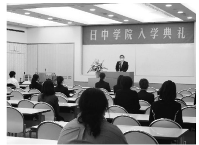
2021. 4 コロナ禍のため本科のみで入学式