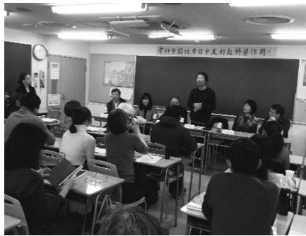
2017. 11 劉震雲ら中国作家代表団との交流会