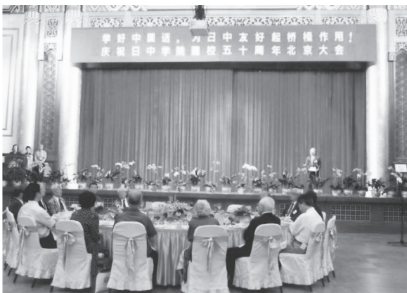
北京飯店での豪華な創立50周年記念集会