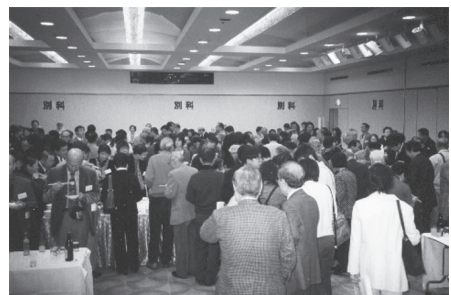
2001. 11 創立50周年大同窓会東京大会 500名を越える同学が会場を埋め尽くしました