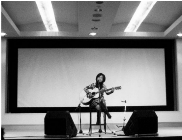
2007. 2 創立55周年記念 日本語科卒業生「aminトークライブ」