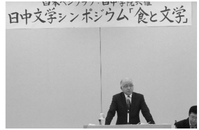
2015. 11 日中文学シンポジウム「食と文学」 (日本ペンクラブとの共催) 浅田次郎氏講演