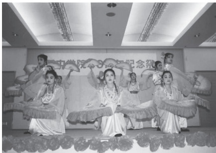
1991. 11 創立40周年記念祭