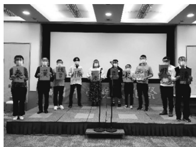
2020. 10 コロナ禍での文化祭 (本科2年)