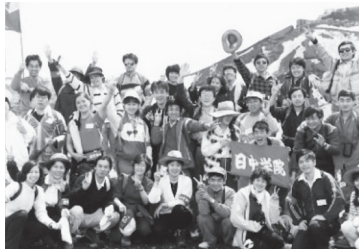
日本語科富士登山 1995年まで続けられました