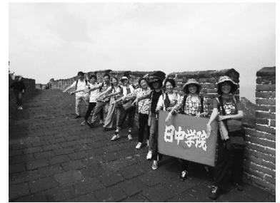
2018. 7 本科北京短期留学 早く再開したいものです