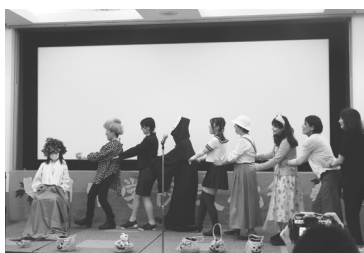
本科2年 拔呀拔呀拔萝卜

けど、歌いたいという気持ちが勝った。ダンスはよくやっていたけど、歌は初めてだった。でも、ちゃんとできてよかった。緊張の気持ちと楽しい気持ちが混ざっていた。これが青春なのかな、と思った。