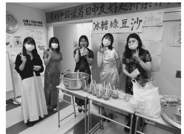
本科2年 冰糖绿豆沙

こういうアイデアはかしこい。世界の有名な商人はこのような発想で自分の企業を作ったのだろう。文化祭を体験して成長したと思う。来年も思いきり楽しみたい。