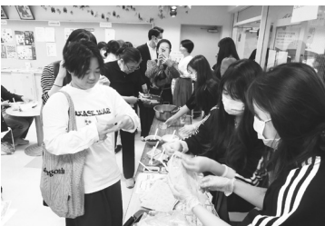
日本語科1-2 酱香餅、冰粉、双皮奶

2024年10月26日、日中学院で文化祭が行われた。私がもし、この文化祭を3つの言葉で表すとすれば、「秋」「責任」「青春」だ。