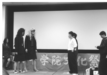
日本語科2-1 「今日から俺は」