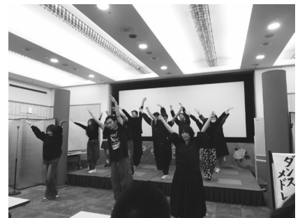
日本語科1-2 「ダンスメドレー」

青春。実は文化祭の前日、突然友達と舞台上で歌を歌うことに決めた。突然なので、練習も少ないし、準備もしていなかった