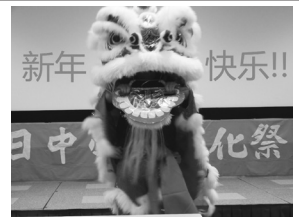
文化祭で留学生が獅子舞を披露しました

文化祭を終えて、私はいろいろ準備をすることがありましたが、みんなで協力していい物を作れたので、とてもいい文化祭ができました。来年もみんなで力を合わせて今年以上の文化祭を作りたいと思います。