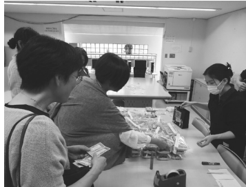
本科1年 炊き込みご飯

私たちの文化祭の準備が始まったのは 9 月の上旬でした。私は初めての文化祭でしたが、文化祭の実行委員長に選ばれました。でも、最初は何から決めて、どのように進めて行けばいいかわからないこともありま